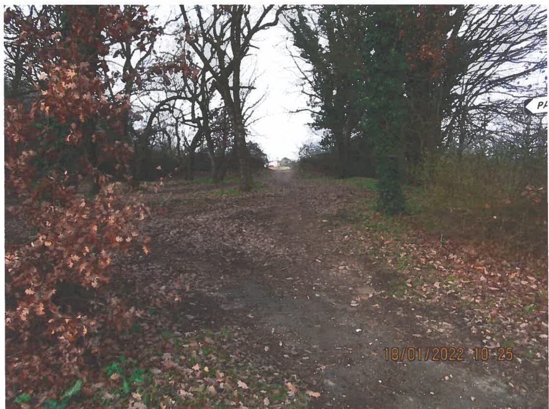
Vue depuis le chemin des Tumulus