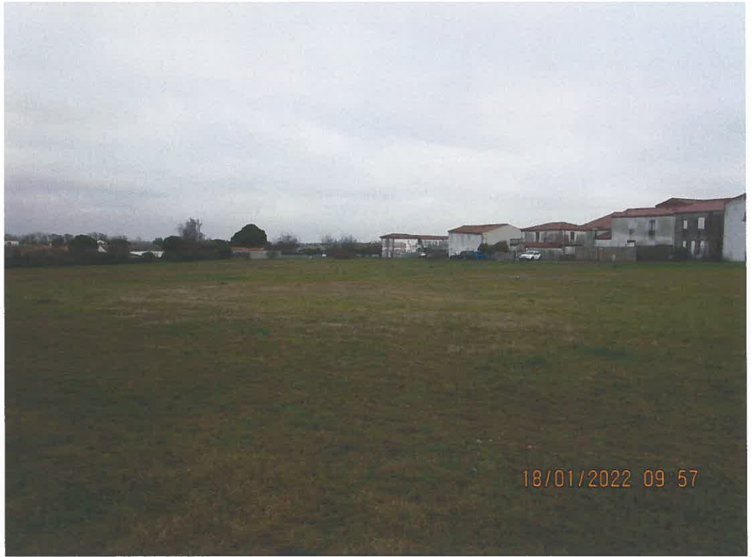
Vue depuis la D116